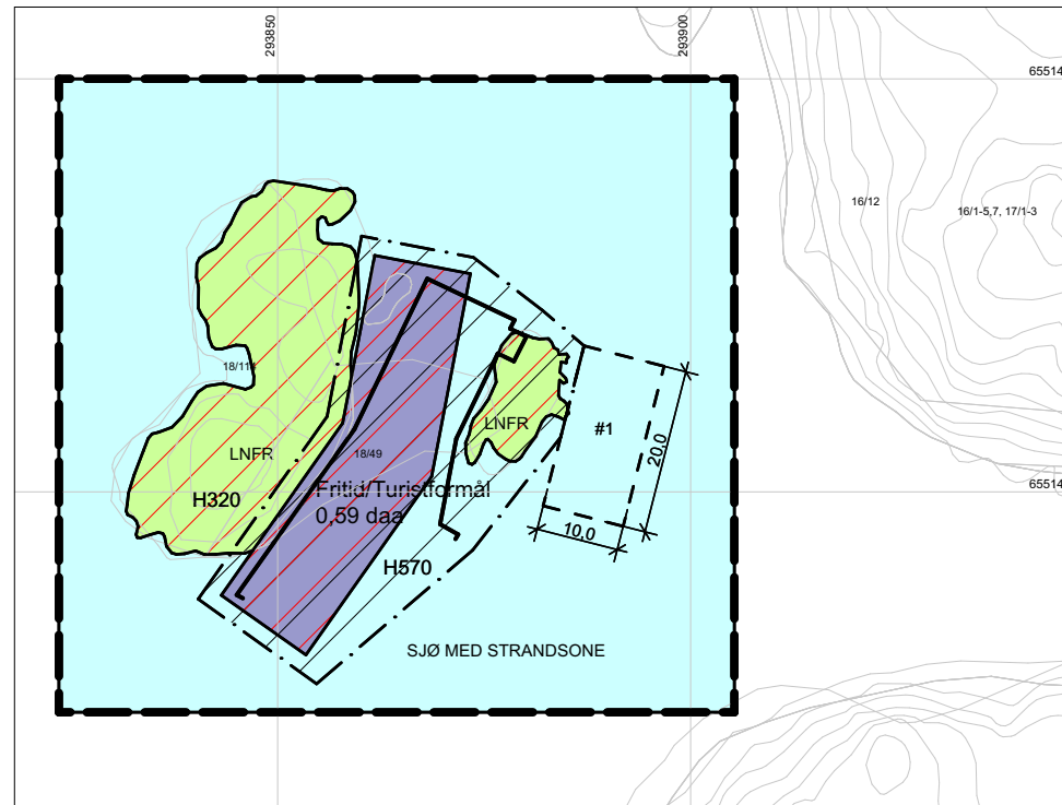
ÅDNØYPARKEN - FT 01