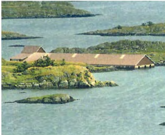
Ydstebøparken. Overdekket hummerpark ferdigstilt 1931.

Bjellandparken, fra Schjelderup & Grams mulighetsstudie 2022