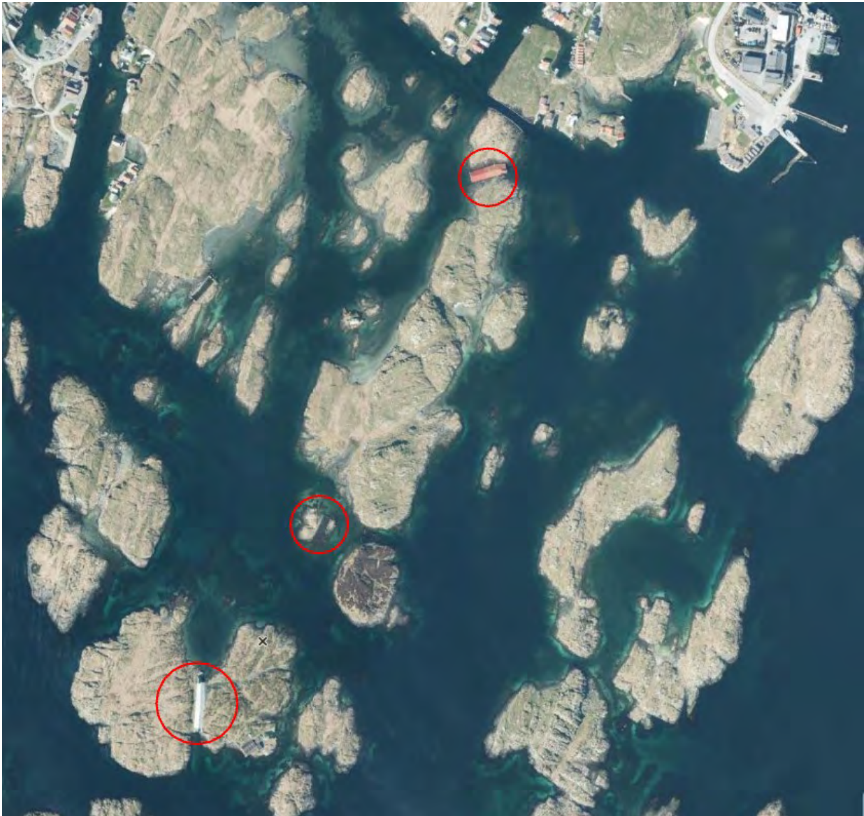
De tre lokalitetene fra nord til sør Ydstebøparken, Ådnøyskjæret og Bjellandparken

De tre lokalitetene ligger med innbyrdes avstand i Kvitsøys skjærgård. Det vil være naturlig at planen har tre formålsområder. I samråd med kommunen vil vi finne hvordan avgrensingen av formålsområdene skal gjøres på plankartet.