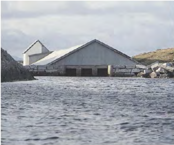
Bjellandparken. Overdekket hummerpark ferdigstilt 1902.

De tre lokalitetene ligger i et naturområde hvor det er få andre menneskeskapte inngrep eller konstruksjoner.